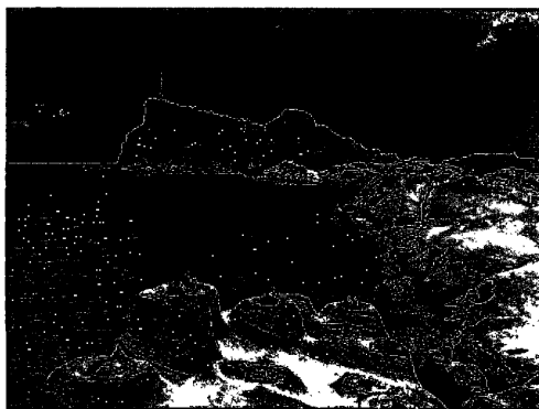
圖 2：台灣地景保育網任選一張地質公園的照片