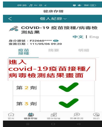
圖 2. 健保快易通，身份證號要顯示