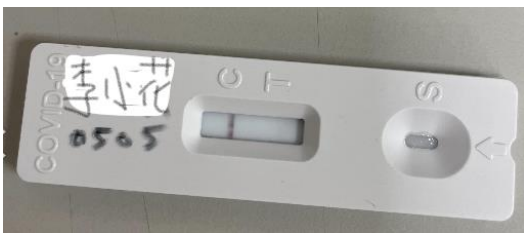
圖 1. 快篩陰性要標註日期及姓名