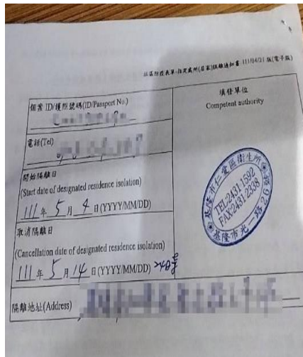
圖 3. 居家隔離通知單