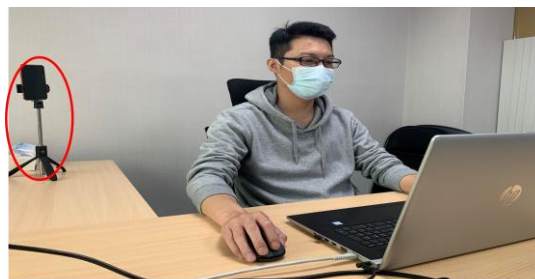
測驗期間需全程開啟視訊及麥克風，並將把手機放置於您坐定的座位斜後方的平台四點鐘或八點鐘方向