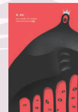
致。自由 學生組佳作 廖建凱

1984年，聯合國通過《禁止酷刑及其他殘忍不人道或有辱人格之待遇或處罰公約》（簡稱「禁酷公約」），截至目前為止已有173個國家加入批准，未來期許禁酷公約施行法草案儘快在立法院審議通過，杜絕各種形式的酷刑及虐待在台灣發生。