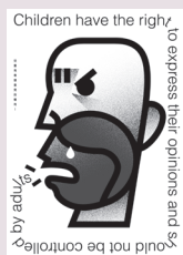
No Opinion! 社會組佳作 陳政昌

「兒童是國家未來的主人翁」，這是一句許多人都耳熟能詳的口號；然而，兒童「現在」就是自己的主人，他們從出生開始就和成人一樣，擁有不受歧視、兒童最佳利益、生命生存及發展、自由表達意見等權利。