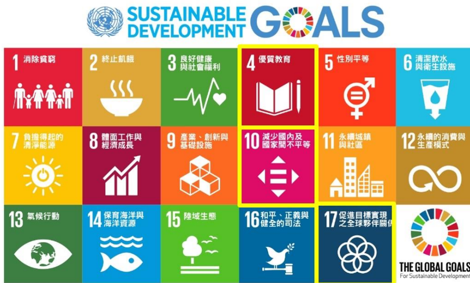
圖 1. 本次活動連結永續發展項目之 4、10、17 項

同時本次活動希望提倡族群平等共融、培養參與學生社會實踐素養，以及做為大學善盡社會責任之表現，本次活動同時與聯合國永續發展項目 (Sustainable Development Goals, SDGs) 進行連結，相關結合目標說明如下：