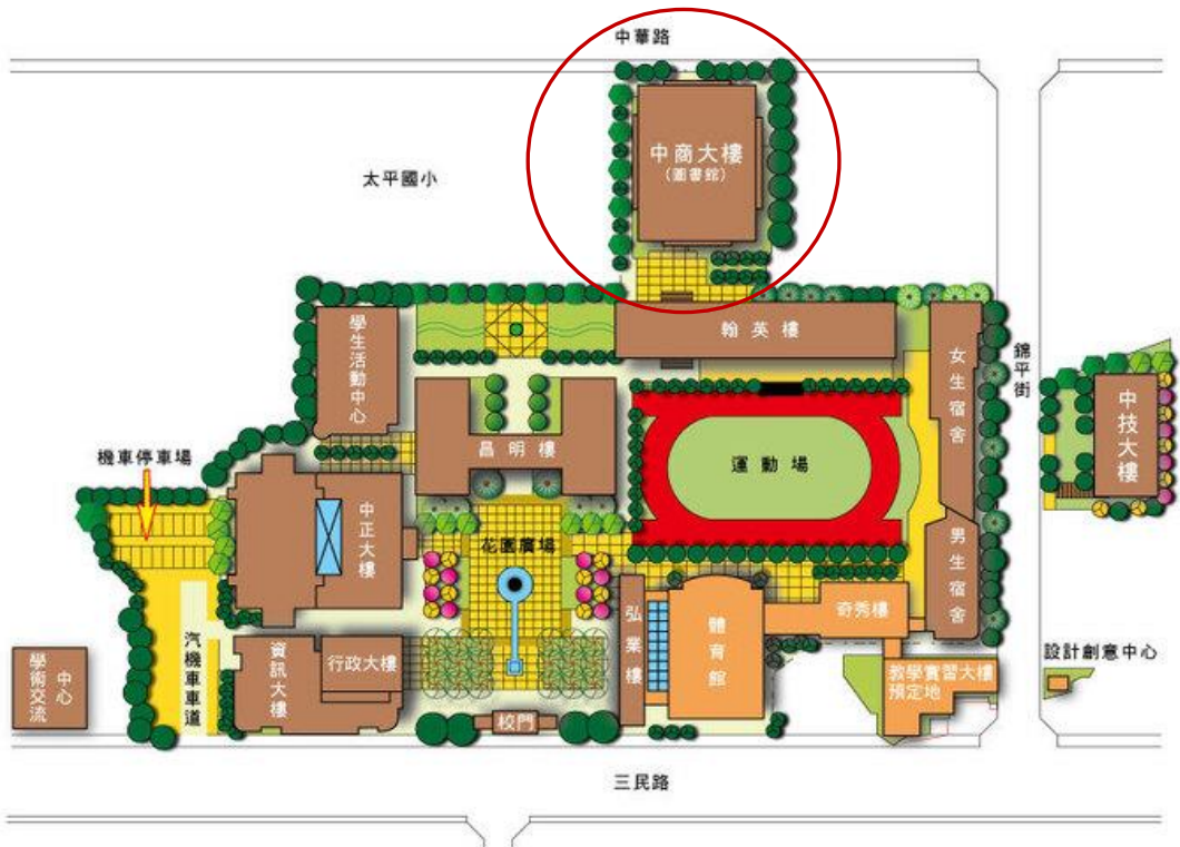
國立臺中科技大學校園地圖