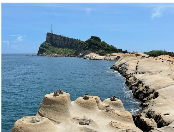
圖 1 台灣地景保育網任選一張地景的照片或自行拍攝或選用照片(請務必註明出處)