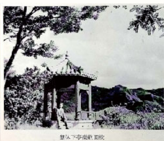
▲當年興建好的敬樂亭