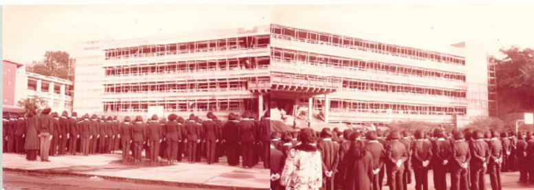
▲興建中的行政大樓