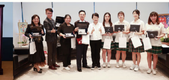
▲專訪盧秀燕市長校友