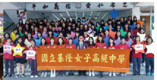
▲近年來女中繁星點點，升學亮眼(圖為109年度)