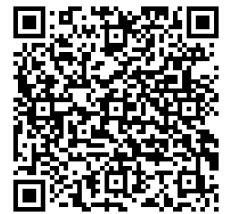
學生回饋意見 QR code

註：學生學習成果表：包含使用本教案之教學目標設定、教學歷程轉換、教學成效建議或教學省思回饋等，並說明課程辦理情形，包括活動照片、學生作品（如學習單）或影片（檔案 1GB 以內）。