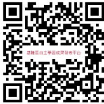
基隆區協作共好計畫自主學習成果發表平台

1、113 學年度高級中等學校適性學習社區推動校訂課程及彈性學習時間與大專校院協作共好計畫由本校擔任基隆區召集學校，採區域學習共同體的概念，以多元形式並適切結合鄰近大專校院之優質學術資源，引領基隆區各高級中等學校在校訂必修、校訂選修、彈性學習時間(含自主學習)之深化發展，促發學生學習動機，增進學生學習自信。