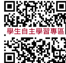
本校學生自主學習專區