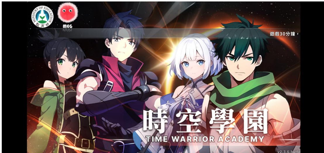
《時空學園》遊戲畫面：